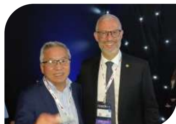
Gilberto Takao Sakamoto com o atual ministro da Educação, Victor Godoy Veiga

Uma experiência inovadora. Assim pode ser definida a participação do CRT-SP na 22ª edição da FUTURECOM, maior feira de tecnologia, telecomunicações e transformação digital da América Latina, realizada no período de 18 a 20 de outubro de 2022 no São Paulo Expo, palco de grandes eventos corporativos da capital paulista. Na abertura o presidente Gilberto Takao Sakamoto teve a oportunidade de conversar com o atual ministro da Educação, Victor Godoy Veiga, sobre a importância da profissão técnica em todos os setores de serviços que movem a economia do país, bem como das atividades que têm sido realizadas pelo conselho no sentido de valorizar a profissão e defender a sociedade frente às antipráticas do exercício profissional. Saiba mais.